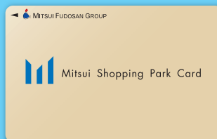
三井ショッピングパークポイントカード

※ラゾーナ川崎プラザポイントカード、ラゾーナ川崎プラザカード 《セゾン》も対象となります。