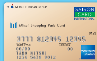
三井ショッピングパークカード《セゾン》