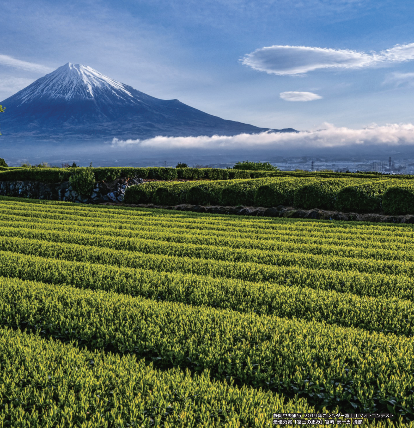
静岡中央銀行 2019年カレンダー富士山フォトコンテスト 最優秀賞「富士の恵み」宮崎 泰一氏 撮影