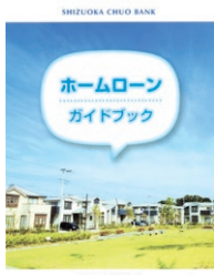
〈しずちゅう〉の住宅関連ローンの総合ガイドブック