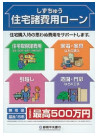
住宅取得時の様々な諸費用に対応無担保で最大500万円